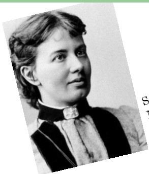
Sofía Kovalevskaya. Matemática